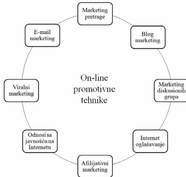
Slika 1. Najaktuelnije on-lajn promotivne tehnike

Postoje brojni instrumenti promocije na Internetu, odnosno on-lajn promotivne tehnike koje stoje na raspolaganju marketing sektoru svakog preduzeća. Trenutno najzastupljenije on-lajn promotivne tehnike su: marketing 1 pretrage, Internet oglašavanje, odnosi sa javnošću na Internetu,